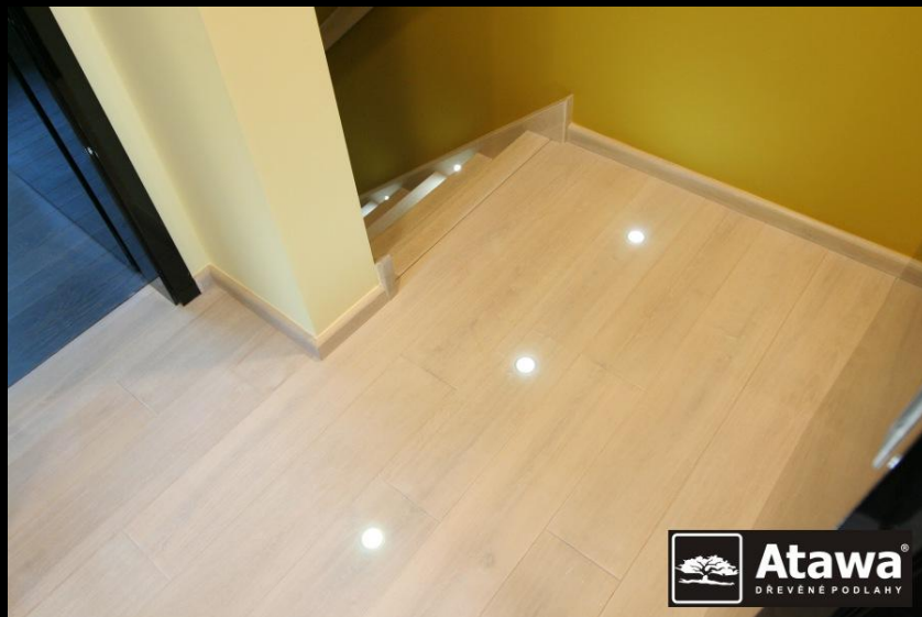
Lišta White pearl MD360