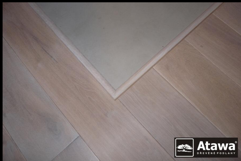
Lišta HW130 – mezi dlažbou a dřevěnou podlahou

Moření – pro získání podkladové barvy se používají vodou ředitelná a louhová mořidla, další dvě vrchní vrstvy vždy tvoří tvrdý voskový olej.